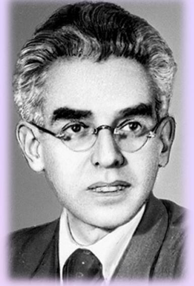
А.Р. Лурия советский психолог, врач-невропатолог, один из основателей нейропсихологии

Нейропсихология — интегративная наука, которая объединила в себе знания медицины, психологии и педагогики