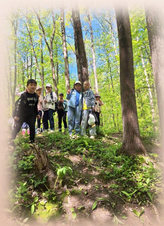
квест “Хочу все знать!”