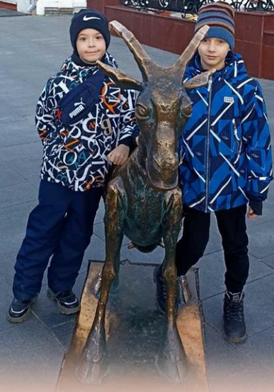
Экскурсия по историческим местам города