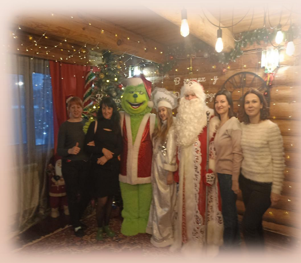
На пороге Нового года