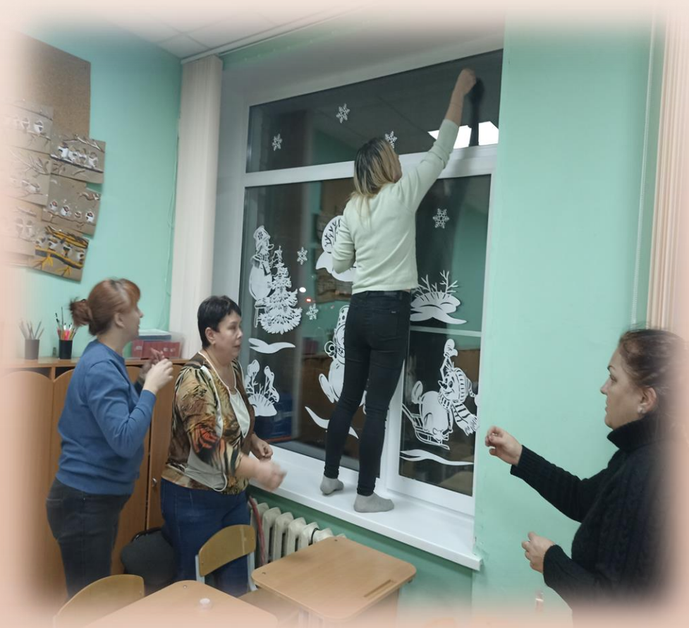
Совместная подготовка к новому году