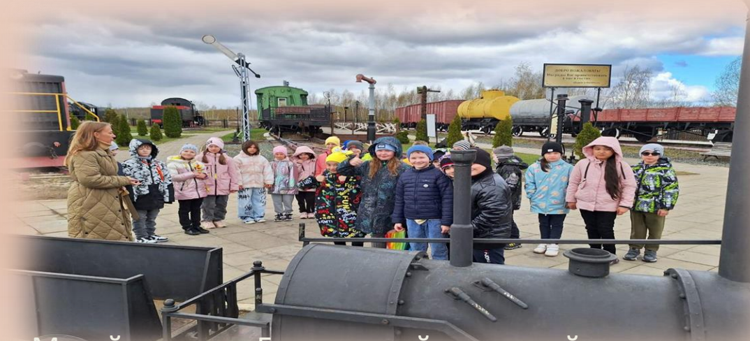
Музей истории Горьковской железной дороги