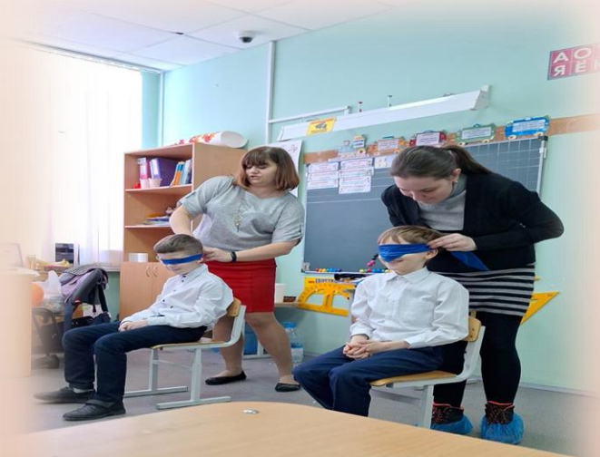
“Веселые экзамены”- эстафета