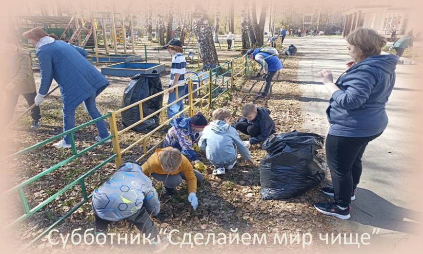
Субботник “Сделаем мир чище”