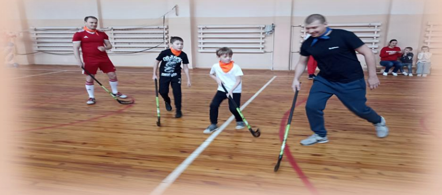
Соревнования по флорболу