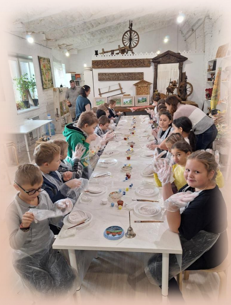
Мастер-класс "Волшебная глина"