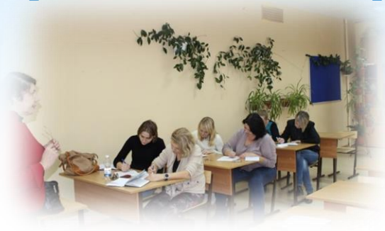
Городской совет по инклюзии с участием общественных организаций