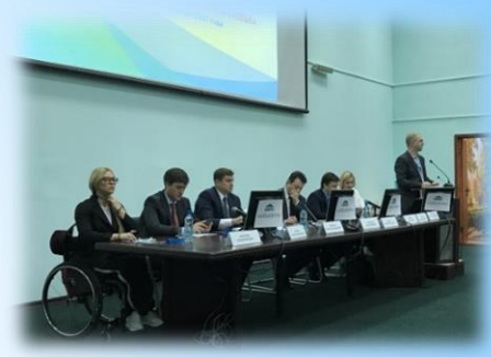
Всероссийские и международные научно-практические конференции